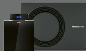
Wärmepumpen-Hybridsystem mit WLW-10 MB A H und Logano plus KB195i-19

Druckprodukt | CO 2 -e-bilanziert und -ausgeglichen | www.natureOffice.com/DE-077-891255