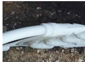
PP-R Reduzierstück d32/DN25