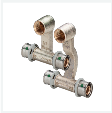
Sanfix P-Sockelleisten-Heizkörperanschlussstück mit SC-Contur Modell 2173 Artikel 409 340