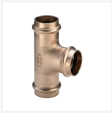
Seapress-T-Stück Modell 0318 Artikel 453 497