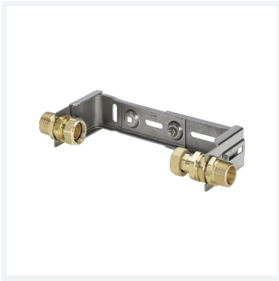
Easytop-Wasserzählerbügel Modell 2230.70 Artikel 554 439