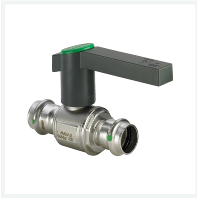
Easytop Inox-Kugelhahn mit SC-Contur Modell 2370 Artikel 554 736