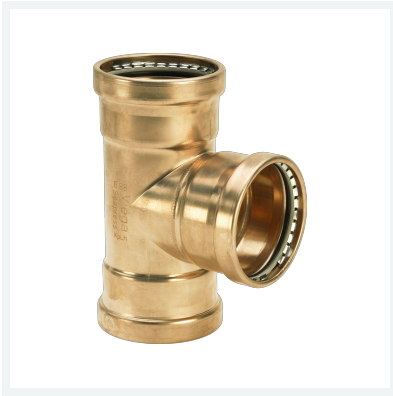
Seapress XL-T-Stück Modell 0318XL Artikel 556 235