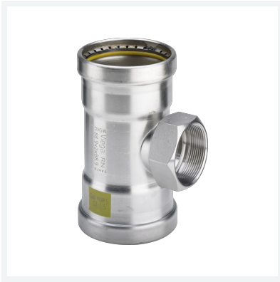
Sanpress Inox G XL-T-Stück mit SC-Contur Modell 0217.2XL Artikel 578 473