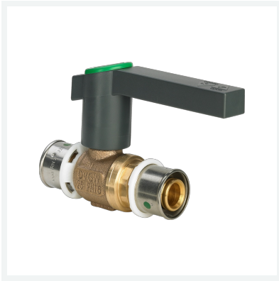
Easytop-Kugelhahn mit SC-Contur Modell 2170 Artikel 587 307