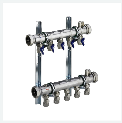
Industrierverteiler DN40 Modell 1007 Artikel 620 844