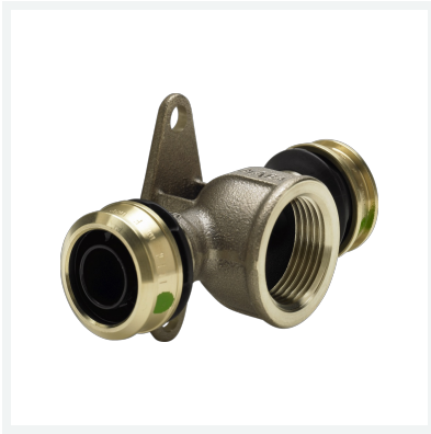
Raxofix-Wandscheiben-T-Stück mit SC-Contur Modell 5325.8 Artikel 647 704