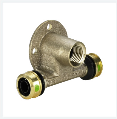
Raxofix-Wandscheiben-T-Stück mit SC-Contur Modell 5324.3 Artikel 647 810