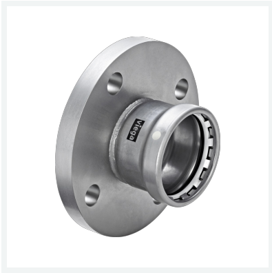
Megapress S XL-Flanschübergang mit SC-Contur Modell 4259.1XL Artikel 751 890