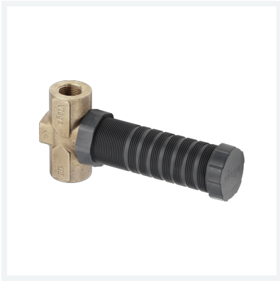
Easytop-UP-Geradsitzventil Modell 2235.3 Artikel 755 645