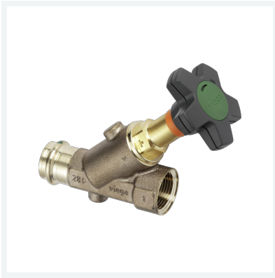
Easytop-Schrägsitzventil mit SC-Contur Modell 2230.52 Artikel 756 697