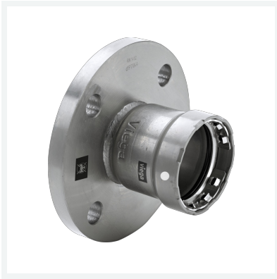
Megapress S-Flanschübergang mit SC-Contur Modell 4359.6 Artikel 770 907