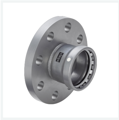
Megapress S XL-Flanschübergang mit SC-Contur Modell 4259.6XL Artikel 770 945