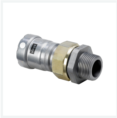
Megapress S-Übergangverschraubung mit SC-Contur Modell 4365 Artikel 770 969