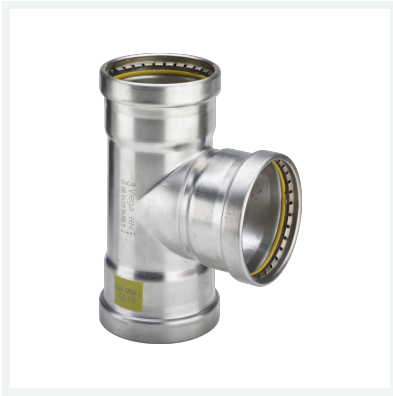
Sanpress Inox G XL-T-Stück mit SC-Contur Modell 0218XL Artikel 795 528