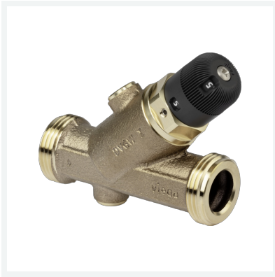
Easytop-Zirkulationsregulierventil statisches Regulierventil Modell 2282.3 Artikel 829 155