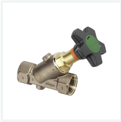
Easytop-Schrägsitzventil (Freistromventil) Modell 2237.2 Artikel 829 285