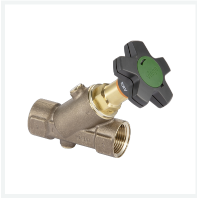
Easytop-KRV-Schrägsitzventil (Kombiniertes Freistromventil mit Rückflussverhinderer) Modell 2238.2 Artikel 829 377