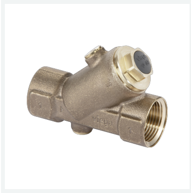
Easytop-Rückflussverhinderer Modell 2239.2 Artikel 829 421