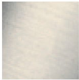
platin matt 83 200 780-06