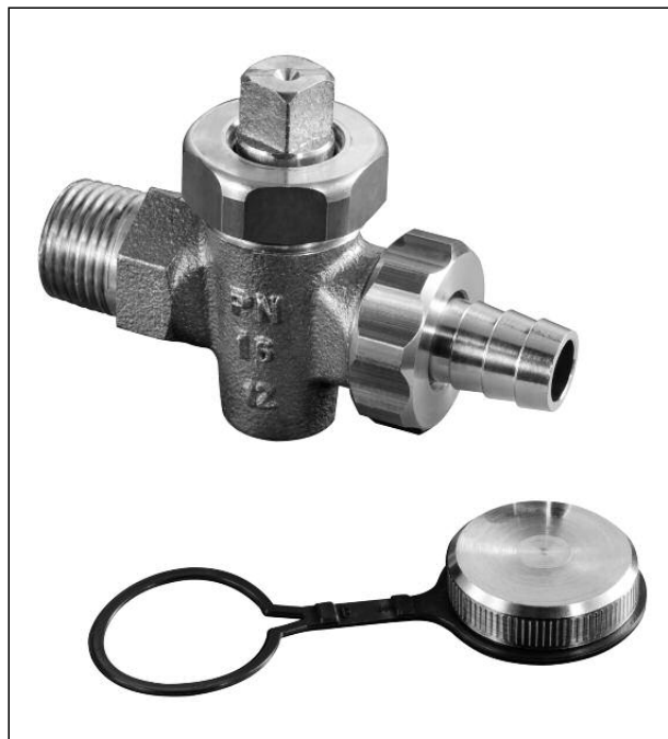
KFE-Hahn mit Schlauchverschraubung